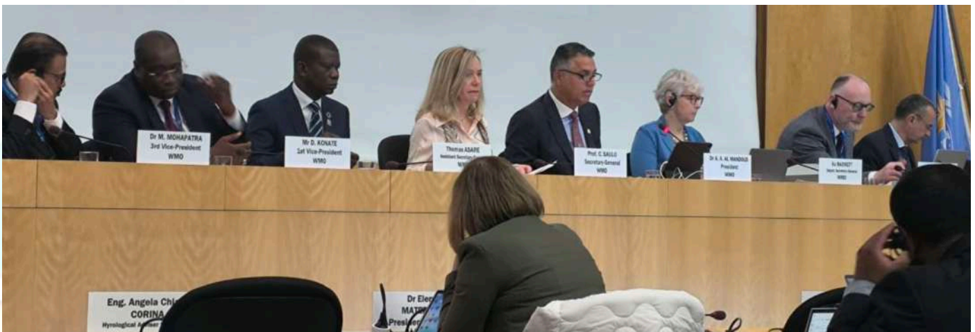
La secrétaire générale de l'OMM, Mme Celeste Saulo (en rose) avec à ses côtés les membres du bureau de l'Organisation Mondiale de la Météorologie (OMM)

Trois experts de la direction de la météorologie nationale ont participé à la 78e session de l'Organisation Mondiale de la Météorologie (OMM) à Genève, du 10 au 14 juin 2024. L'objectif de cette assise était de mobiliser les ressources nécessaires pour faire face aux enjeux climatiques auxquels sont confrontés les pays membres.