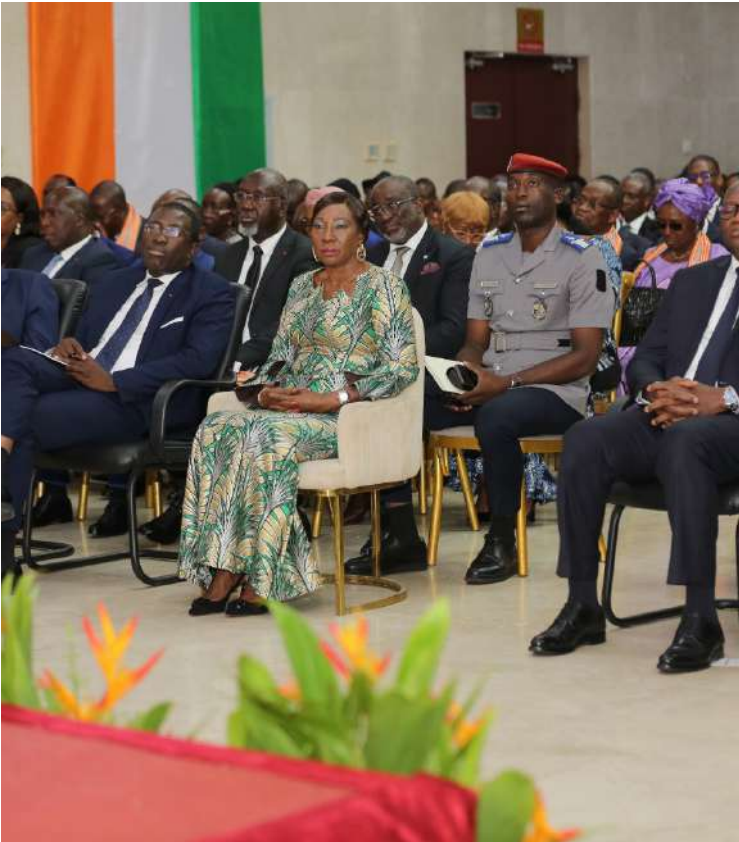
La Présidente du Sénat, Mme Kandia Camara a rehaussé de sa présence la cérémonie d'ouverture de la 2ème édition de la journée de la diplomatie au plateau le 14 juillet 2024