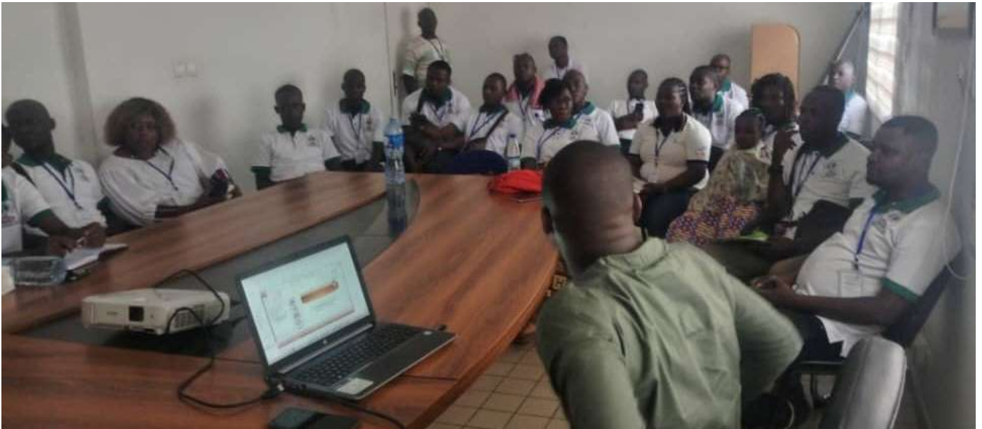
Les étudiants de l'unité pédagogique d'histoire géographique d'Issia suivent la présentation de la SODEXAM faite par le responsable des visites de l'aéroport de Man

La plateforme aéroportuaire de Man a reçu la visite de 22 étudiants de l'unité pédagogique d'histoire-géographie d'Issia, le 10 mai 2024, dans le cadre des activités de fin d'année de l'unité visant à enrichir les connaissances des étudiants sur les métiers de l'aviation et de la météorologie.