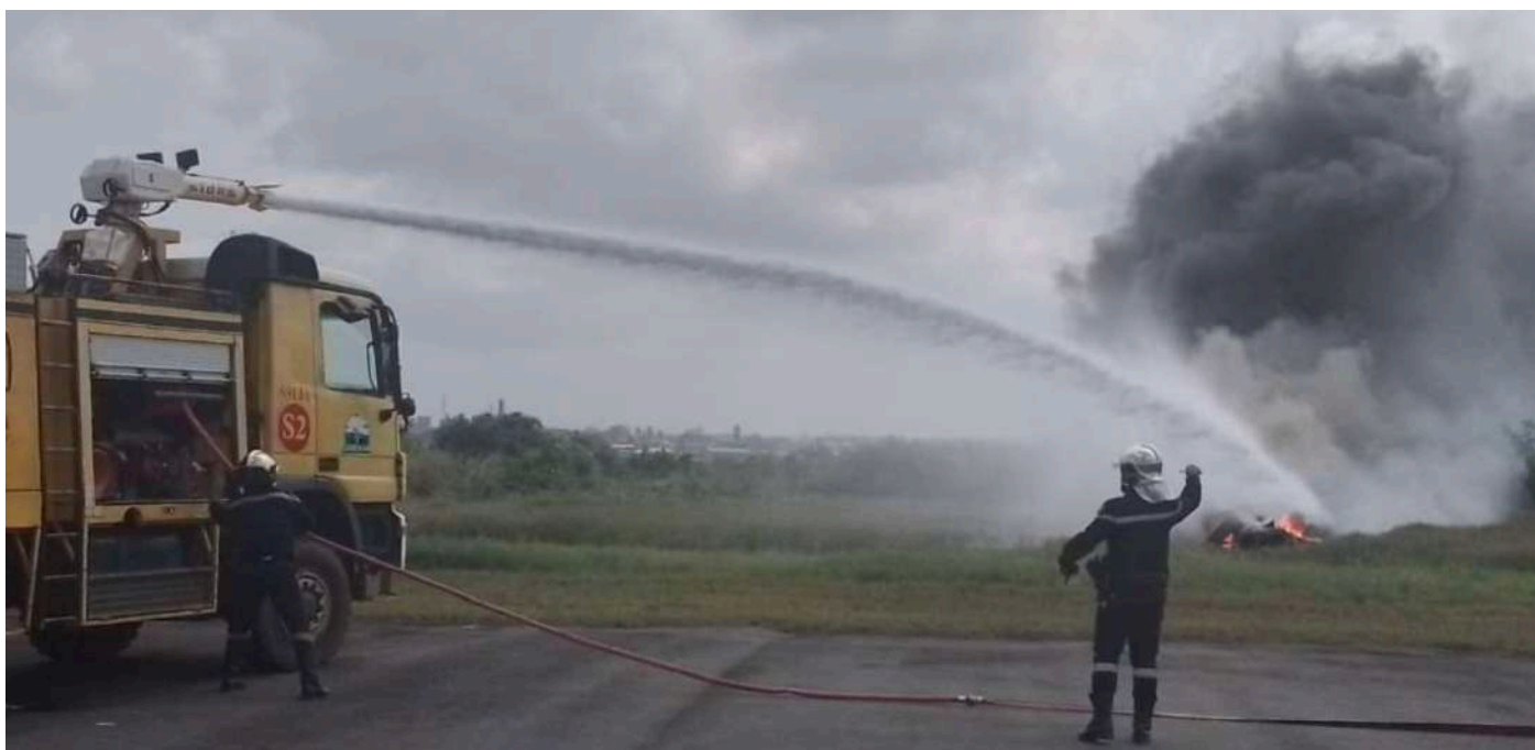
Les pompiers de l'aéroport de San-Pédro en plein exercice de crise de gestion d'incendie

Le personnel du service Infrastructure et Énergie (IE) des plateformes aéroportuaires de la SODEXAM a reçu une formation sur la maintenance du balisage lumineux de piste des aéroports, du 18 au 21 juin 2024, à la salle de réunion de la nouvelle aérogare de San Pedro. La maintenance des balisages est importante pour garantir la sécurité et le bon fonctionnement des opé-