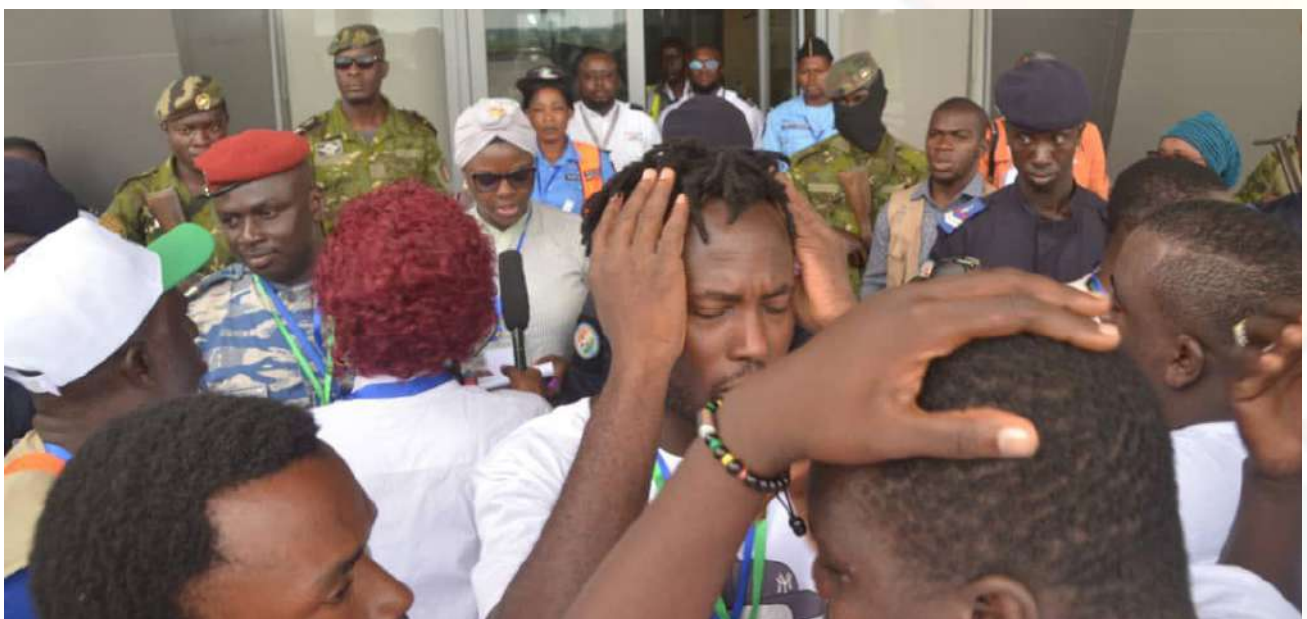
Les parents des victimes sonnés par les informations données par la cheffe DCRP