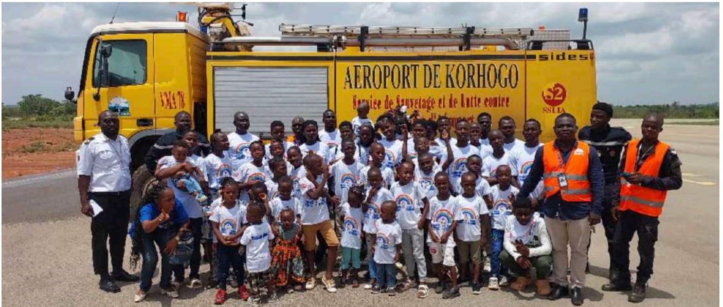
Le commandant adjoint d'Odienné, quelques pompiers, un agent de sûreté, les encadreurs et les élèves posent pour une photo de famille devant le camion pompier

Cinquante enfants de l'église du christianisme céleste d'Odienné ont été accueillis à la plateforme aéroportuaire Lamine Diabaté pour une visite guidée, le 1er juin 2024.