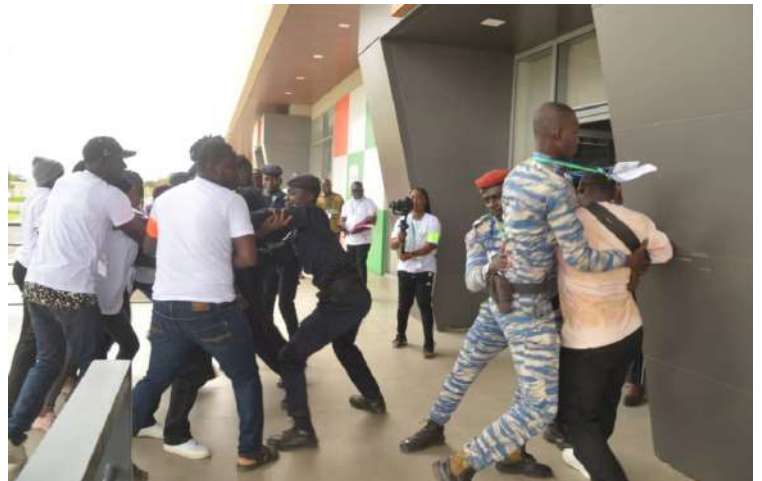
Les forces de l'ordre essaie de calmer la population en panique