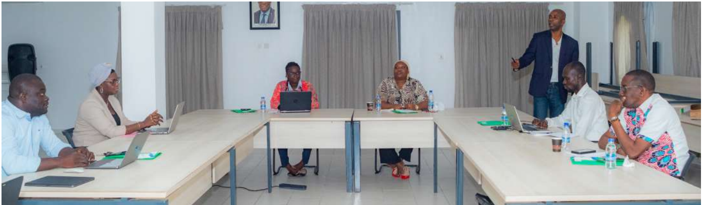
Le département de la communication et des relations publiques en formation dans la salle polyvalente de la SODEXAM