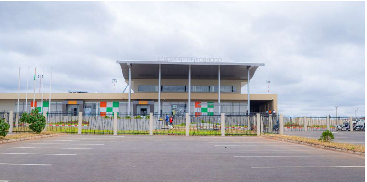
Aéroport de Korhogo

Les aéroports de l'intérieur du pays seront bientôt dotés d'un service d'assistance en escale. La direction générale adjointe chargée de l'exploitation et des opérations techniques (DGAEOT) travaille sur la mise en place de ce service sur l'ensemble des aéroports domestiques en commençant par celui de Yamoussoukro. Son personnel du service d'assistance en escale a bénéficié d'une formation de renforcement de capacité en opérations, trafic, gestion du matériel d'assistance, SGS et sûreté. Par ailleurs, ils ont effectué des stages à l'aéroport International Felix Houphouët BOIGNY d'Abidjan pour allier pratique