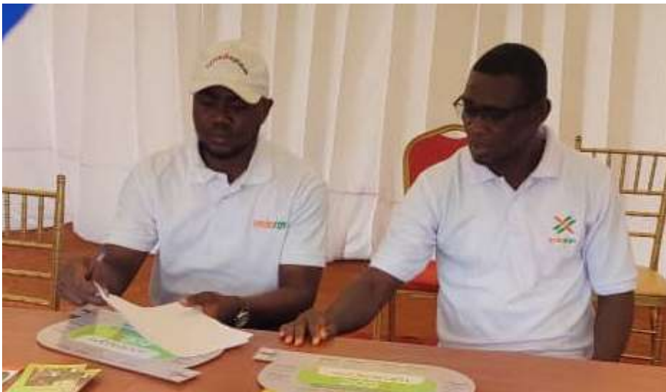
Deux agents de la station météo de Gagnoa animent le stand à la journée de la fonction publique dans le Goh