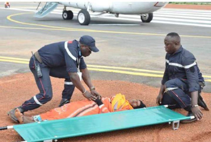
Les pompiers en situation de secours sur un blessé de l'incident sur la piste d'atterrissage