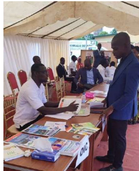
Un participant se fait expliquer le rôle de la Sodexam

Le Ministère de la Fonction Publique a organisé la 4ème édition de la journée de la fonction publique dans la région du Goh. L'évènement s'est déroulé du 24 au 27 juin 2024 dans la ville de Gagno. Objectif, la promotion des services de la fonction publique.