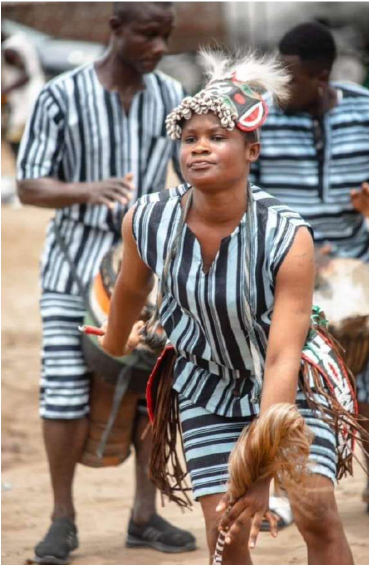
Festival Kahafila - Au cœur de la culture du peuple Gouro