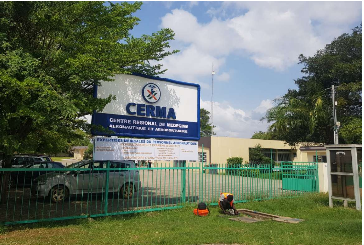
Le Centre Médical de la SODEXAM

Le Département d'Expertises Médicales du Personnel Aéronautique (DEMPA) du CERMA a obtenu, le 18 juin 2024, la certification de l'Autorité Nationale de l'Aviation Civile (ANAC), dénommée « agrément de centre d'expertise médicale et du personnel aéronautique ».