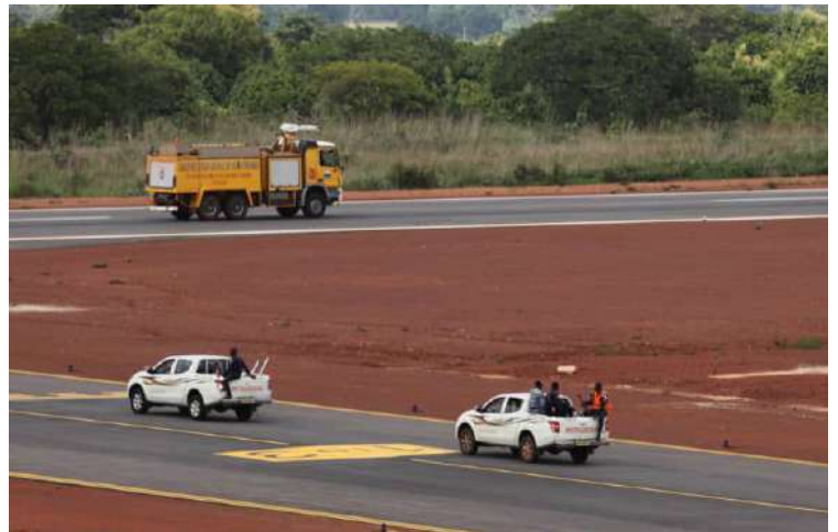
Le VMA plus 02 voitures d'interventions en route pour le lieux de l'incident