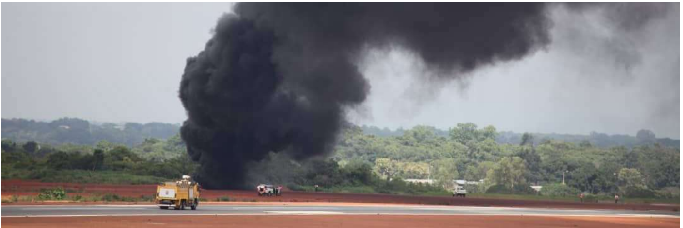
Le VMA sur la piste d'atterrissage pour maîtriser l'incendie

La Société de Développement et d'Exploitation Aéronautique Aéroportuaire et Météorologique, SODEXAM, a organisé, le jeudi 25 juillet 2024, un exercice général de simulation de gestion de crise en sécurité et sûreté à l'aéroport de Korhogo, deux mois après l'inauguration fait par le Vice-Président de la République. Cet exercice dénommé « Exo Kagnonon 2024 » ou la bonne chose en langue Senoufo est une première sur un aéroport domestique de la Côte d'Ivoire. Cette simulation de gestion de crise dont l'objectif est d'éprouver le système de défense pour tout incident et accident qui pourrait subvenir à l'aéroport de Korhogo a testé la réaction générale des acteurs intervenant dans le plan d'urgence.