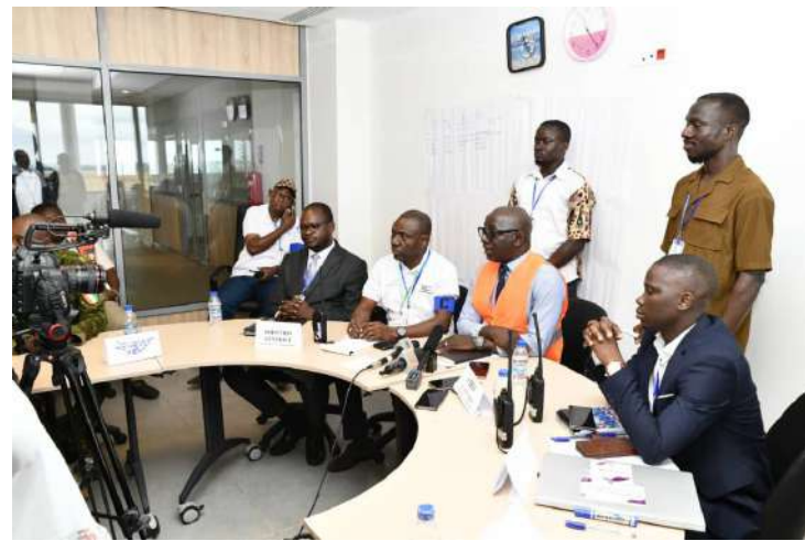
Le Directeur Général adjoint en orange donne l'état de la situation de l'incident aux journalistes présents en salle