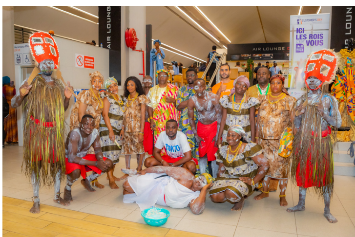
L'équipe de la sodexam au concours des customer's day