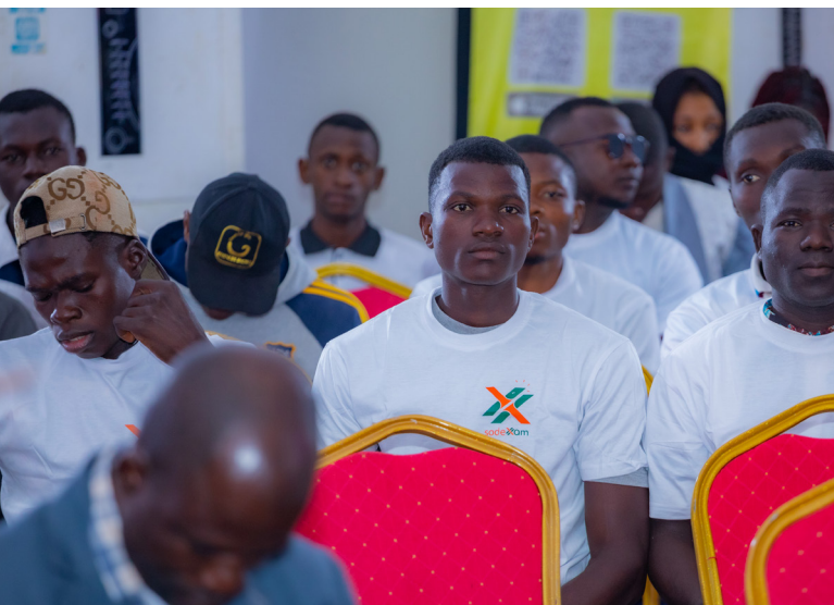
Le public attentif à la présentation de la cheffe DCRP