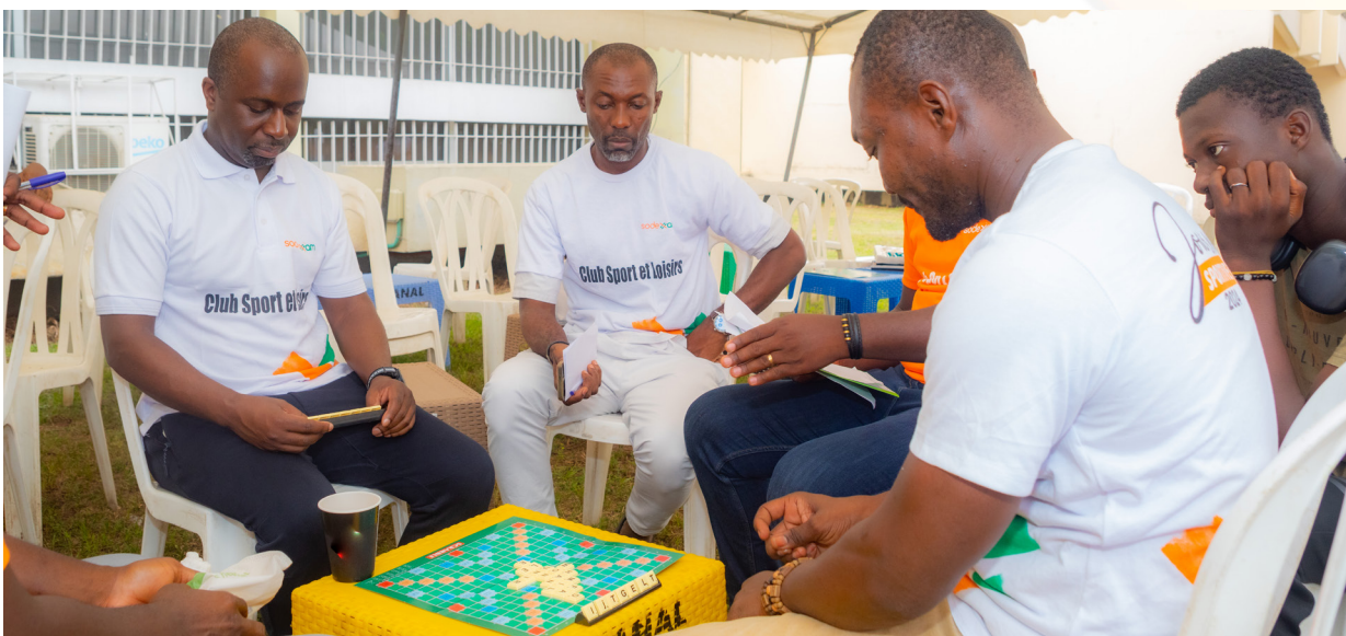
Jeu de scrabble