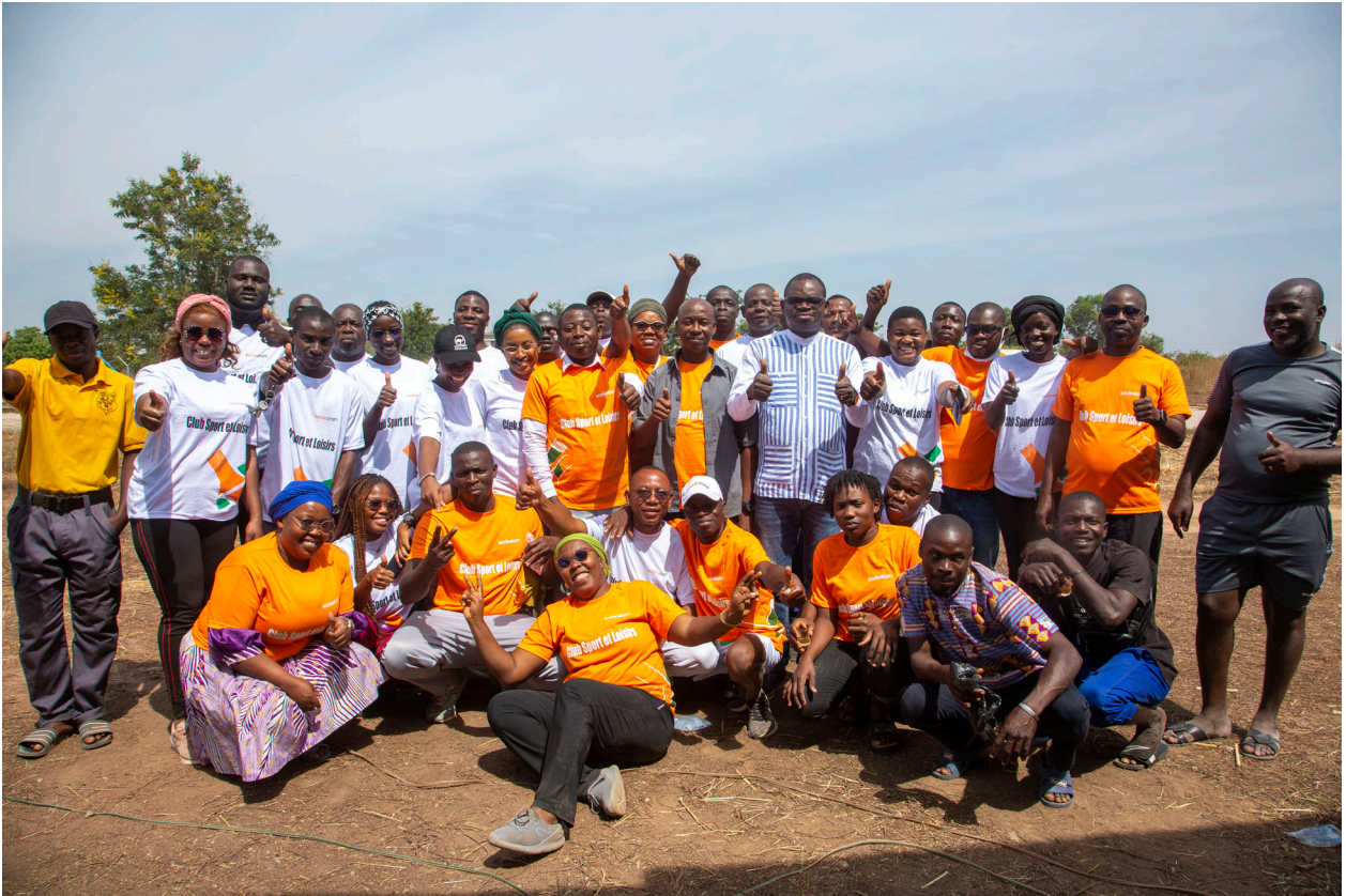
Photo de famille à l'issue de la journée sportive JLM de Bouaké