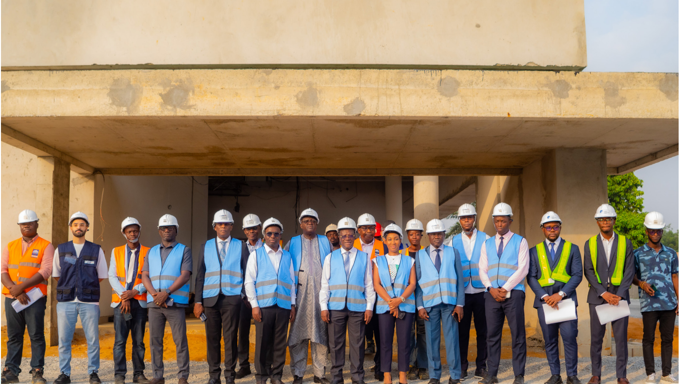
Photo d'ensemble devant le nouveau siège en construction

Les membres du Conseil d'administration de la SODEXAM se sont dits satisfaits de l'avancée des travaux du nouveau siège de la SODEXAM, à la suite d'une visite effectuée sur le chantier de construction, le vendredi 20 décembre 2024, afin de faire le point de l'avancement des travaux de cet ambitieux projet.