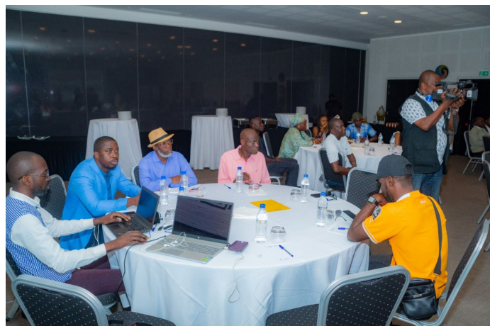
Les journalistes, attentifs à la présentation du DG