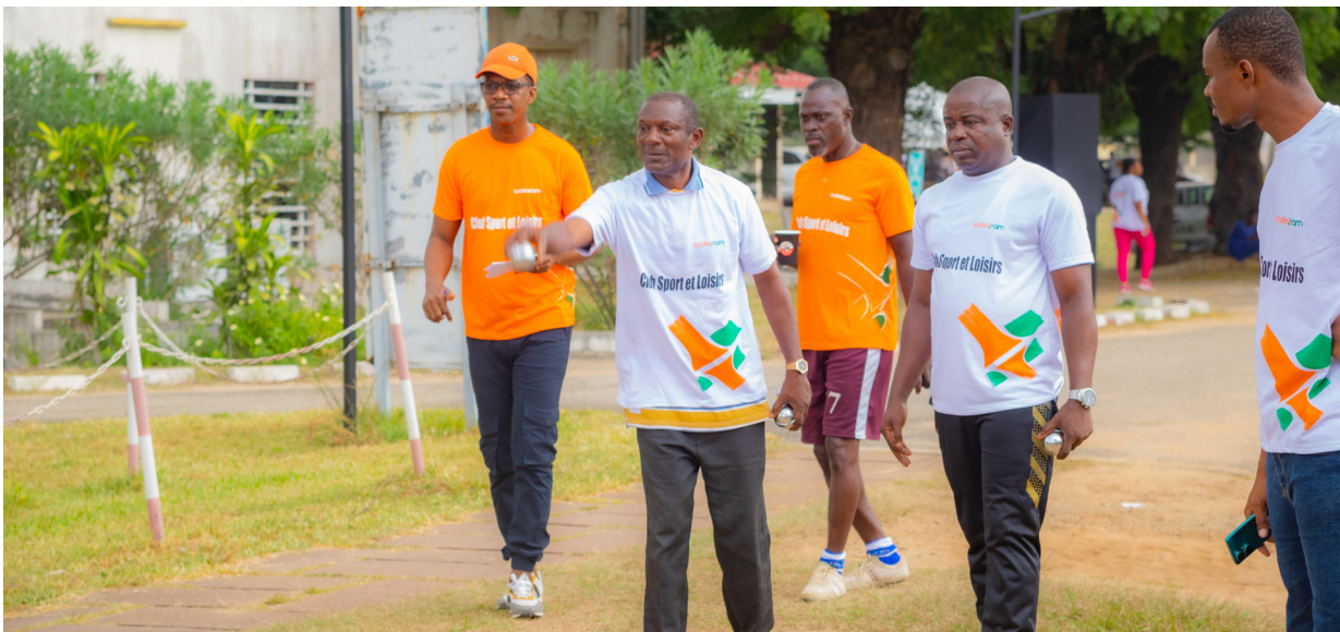
Jeu de pétanque