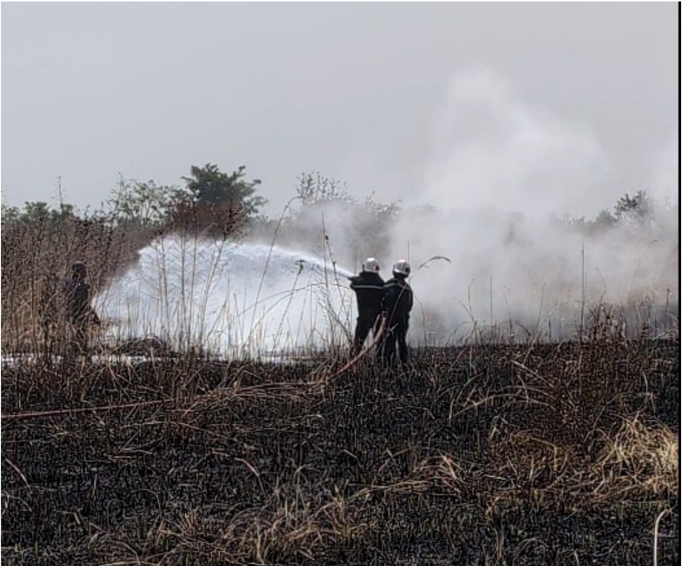
L'unité SLI en plein exercice de simulation sur feu réel

L'Unité de Sauvetage et de Lutte contre les Incendies d'Aéronef (SLIA) de l'aéroport de Yamoussoukro a mené un exercice de simulation sur feu réel, le lundi 23 décembre 2024 dont l'objectif était de tester la capacité opérationnelle des pompiers et leur réactivité en urgence.