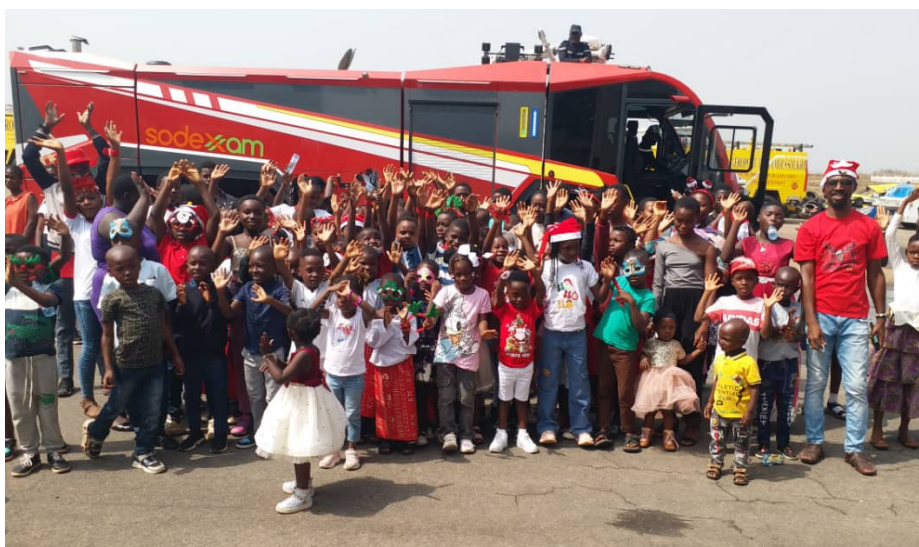
Photo de famille devant le VMA