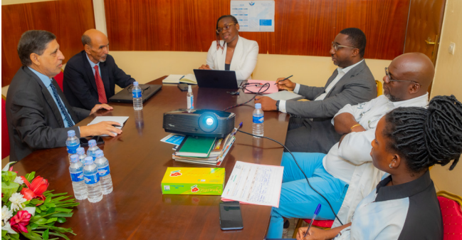
Séance de travail entre l'équipe d'évaluation de Mauritanie, la Directrice de la conformité, le Directeur du CERMA et le Médecin Chef du DEMPA