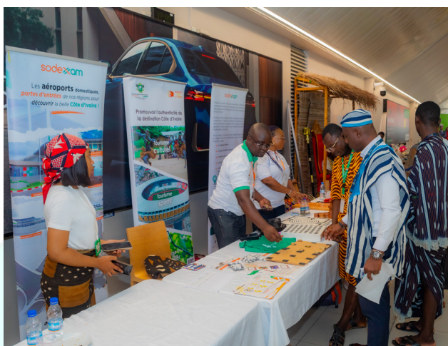
Quelques visiteurs au stand de la SODEXAM