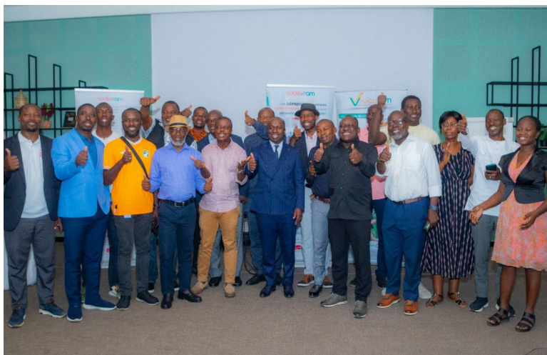
Satisfaits de leurs échanges, les journalistes et le DG immortalisent la rencontre

Au cours d'un déjeuner de presse et d'une rencontre, le Directeur Général de la SODEXAM, a échangé avec la presse nationale et internationale, et le personnel. C'étaient les vendredi 17 et mardi 21 janvier 2025, à l'hôtel ONOMO, à la salle polyvalente.