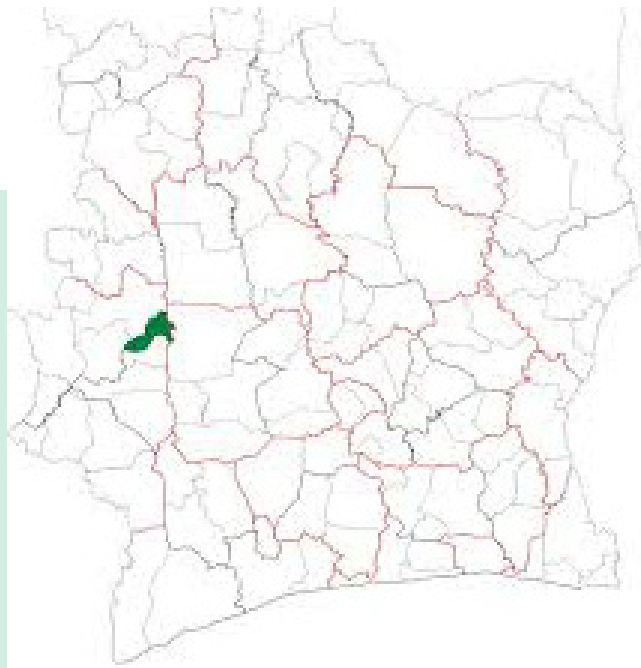
Localisation de Facobly sur la carte de la côte d'ivoire

Le climat à Facobly est caractérisé par une chaleur persistante tout au long de l'année, avec deux grandes saisons distinctes. La saison pluvieuse est oppressante et marquée par un ciel souvent nuageux, tandis que la saison sèche est lourde mais partiellement dégagée.