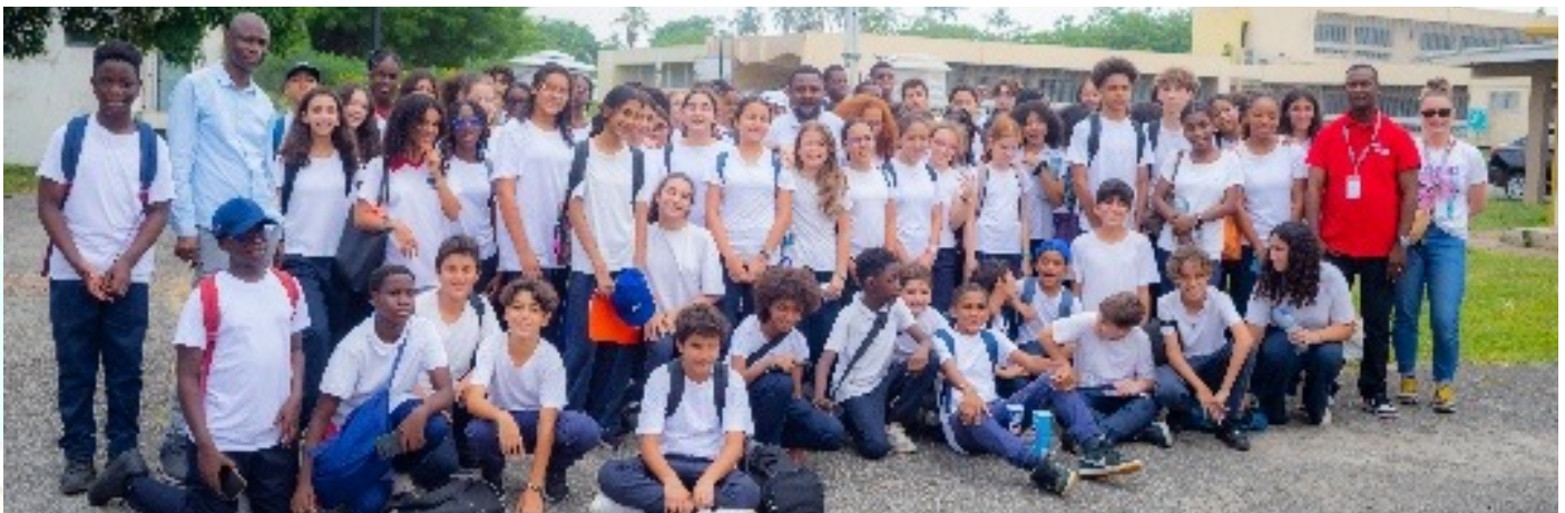
Photo de famille à l'issue de la visite des élèves du lycée international Jean Mermoz

90 élèves des classes de 5e et de 3e du lycée international Jean Mermoz ont visité la SODEXAM, le mercredi 18 décembre 2024, pour découvrir l'univers de la météorologie.