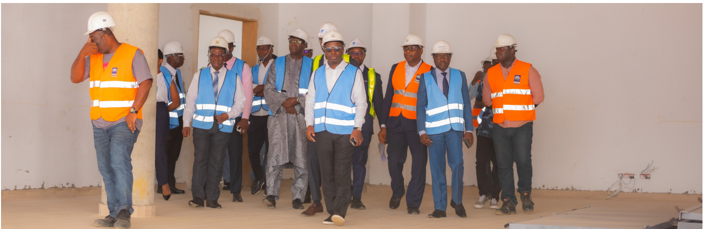
Des administrateurs et des membres du comité de direction dans le hall du bâtiment