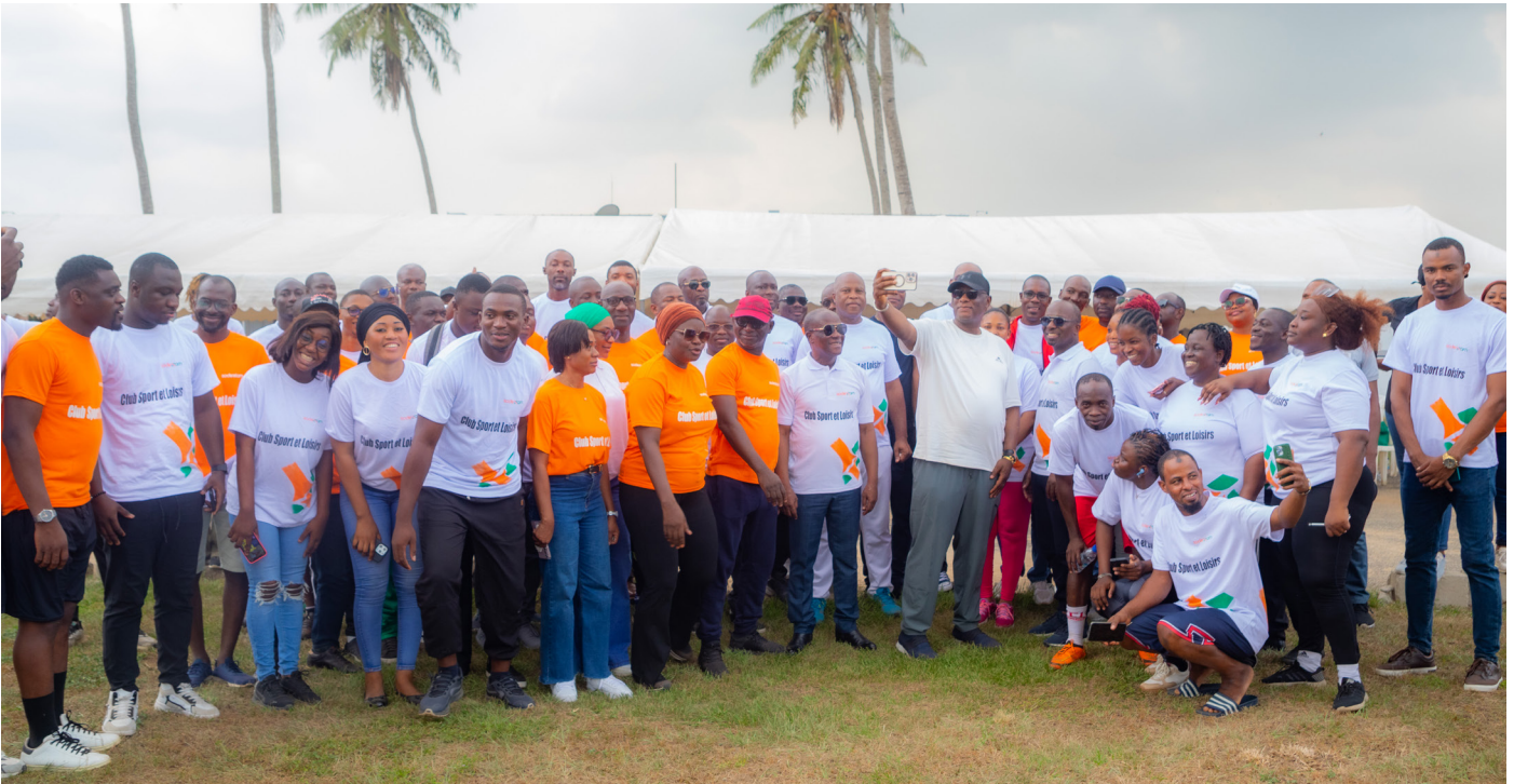
Photo de famille avec l'ensemble des agents de la plateforme d'Abidjan