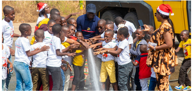
Les enfants apprennent à utiliser le canon à eau