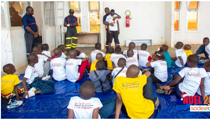
Les enfants suivent le cours sur les 1ers secours