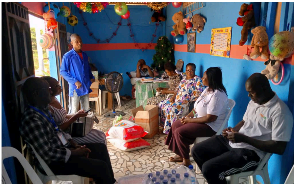
Remise de don à l'orphelinat