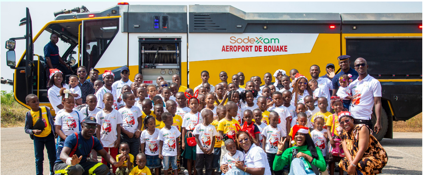
Photo de famille avec les enfants devant le VMA

Le Commandant de l'aéroport de Bouaké a organisé la première édition de la fête de Noël des enfants des agents, le lundi 23 décembre 2024. Cette activité avait pour objectif d'offrir un moment festif et éducatif à une centaine d'enfants, et de renforcer les liens sociaux entre agents.