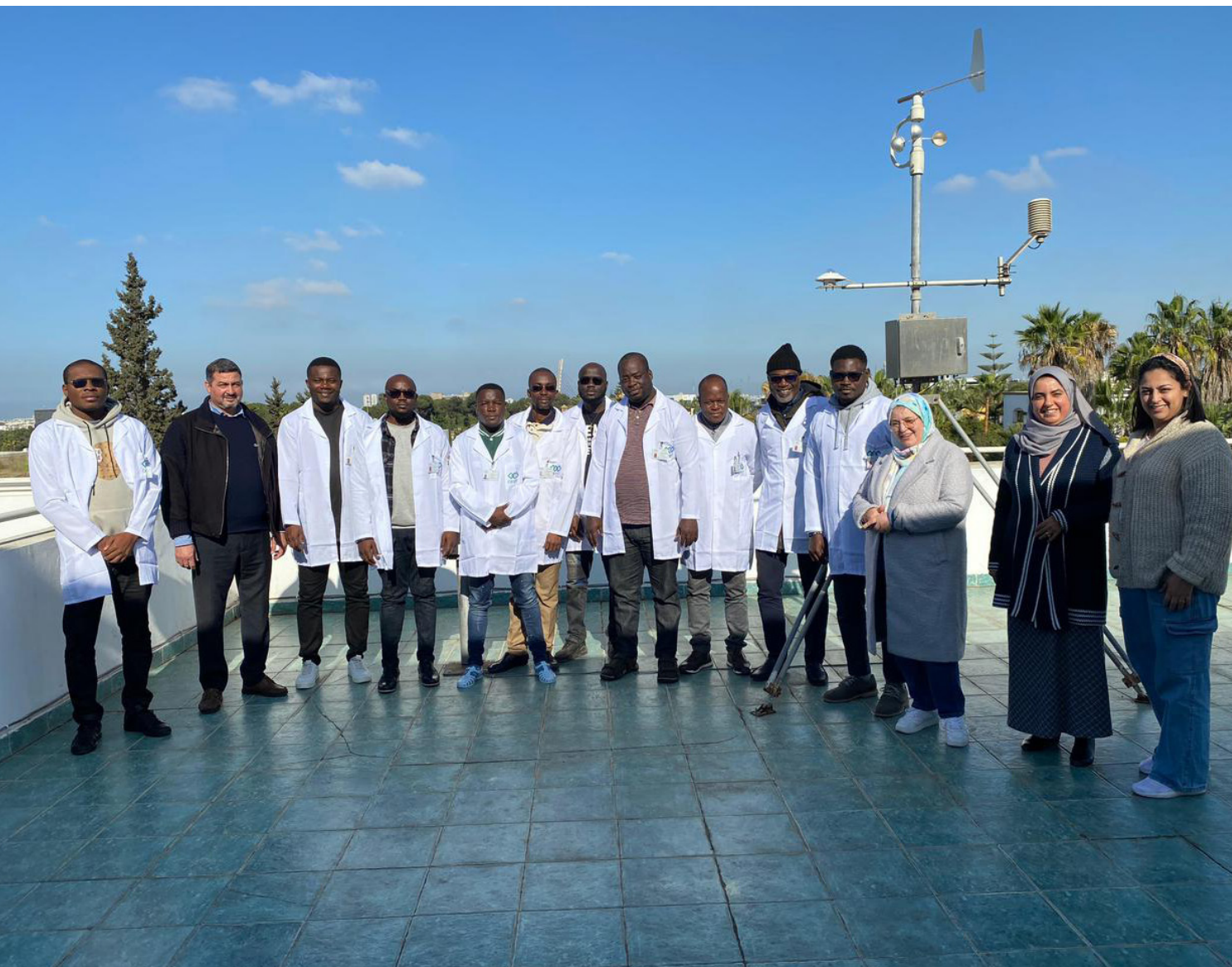
Les agents de la météorologie nationale, en blouse blanche, et leurs formateurs

Dans le cadre du projet VIGICLIMM, dix (10) agents de la direction de la météorologie nationale sont en formation au Maroc à l'Office de la Formation Professionnelle et de la Promotion du Travail (OFPPT), depuis le mois de décembre 2024. Cette formation rentre dans le