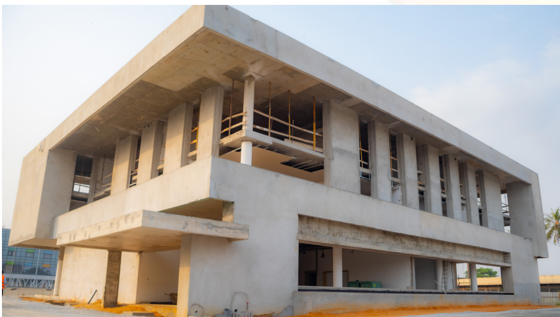
Le bâtiment du nouveau siège de la SODEXAM à 80% de finition