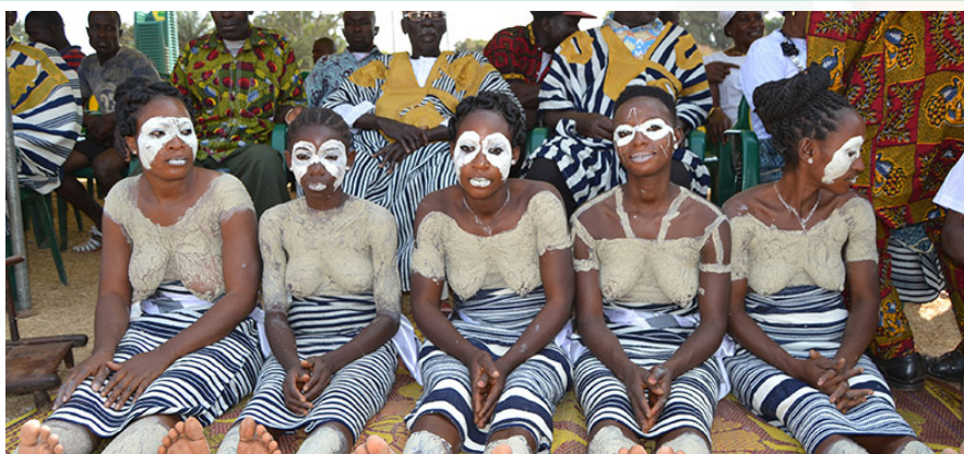
Les femmes guerrières lors du festival de Facobly

En revanche, la période fraîche s'étend de début juillet à mi-septembre, avec des températures maximales inférieures à 29 degrés. Août est le mois le plus frais, avec des températures comprises entre 22 et 28 degrés.