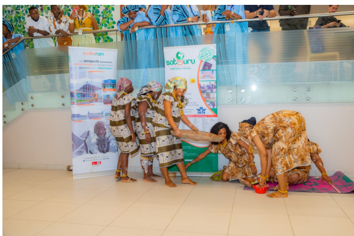
Le passage de la SODEXAM au concours des customer's day