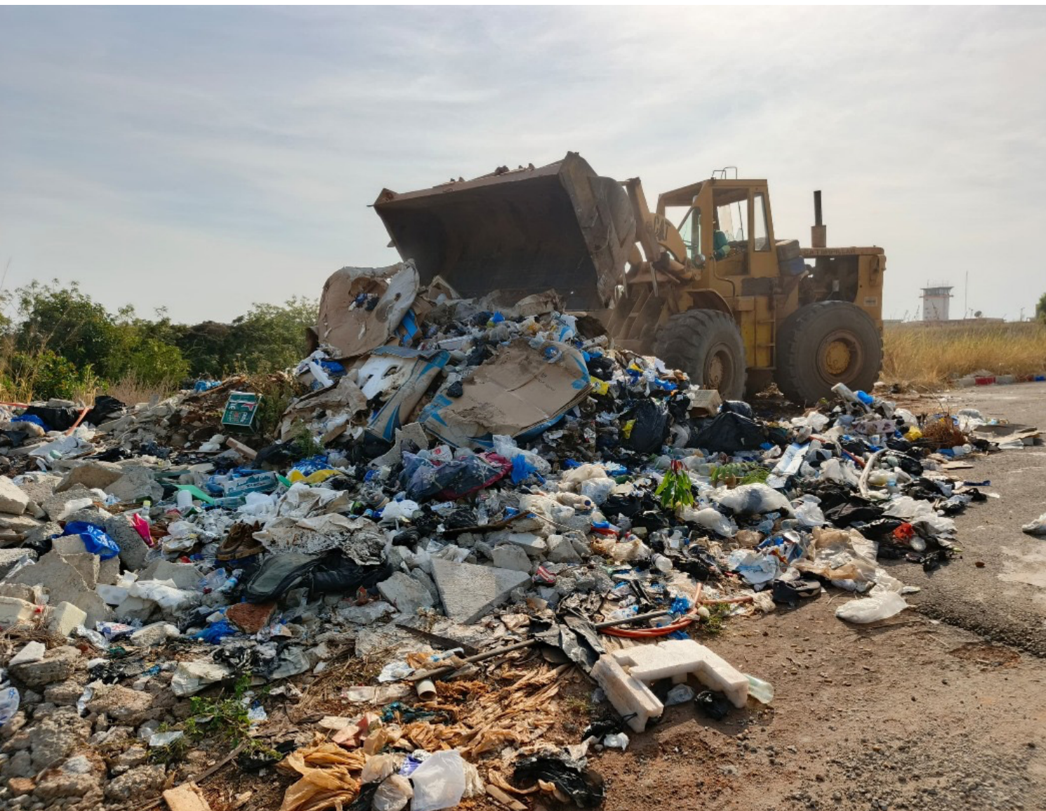
Les ordures collectées

A l'initiative de Pascal Kouamé N'GUESSAN, Commandant de l'aéroport de la ville de Korhogo, une opération d'assainissement a eu lieu à l'aéroport de ladite ville, le samedi 7 décembre 2024, en vue de débarrasser les ordures déversées du côté ville de l'aéroport après les travaux de rénovation.