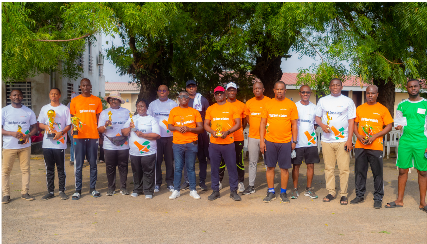
Photo de famille des vainqueurs des jeux, et le président du club sport et loisirs