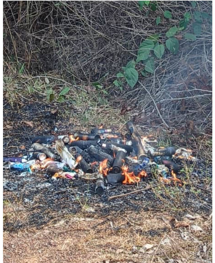
Les autorités de la plateforme de San-Pedro détruisent les articles interdits saisis à l'aéroport

Il a profité de cette occasion pour présenter ses vœux du nouvel an à l'ensemble des partenaires et collaborateurs pour leur engagement en faveur de la sécurité, la sûreté de l'aéroport, aussi bien que pour leur implication dans la réussite des opérations quotidiennes.