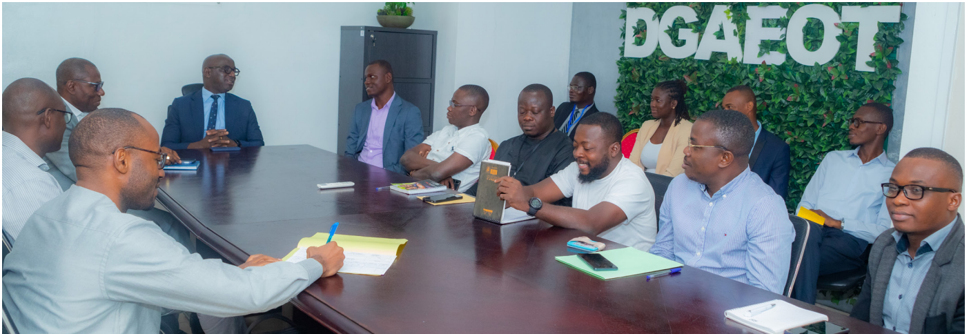
Photo d'ensemble à l'ouverture de la formation