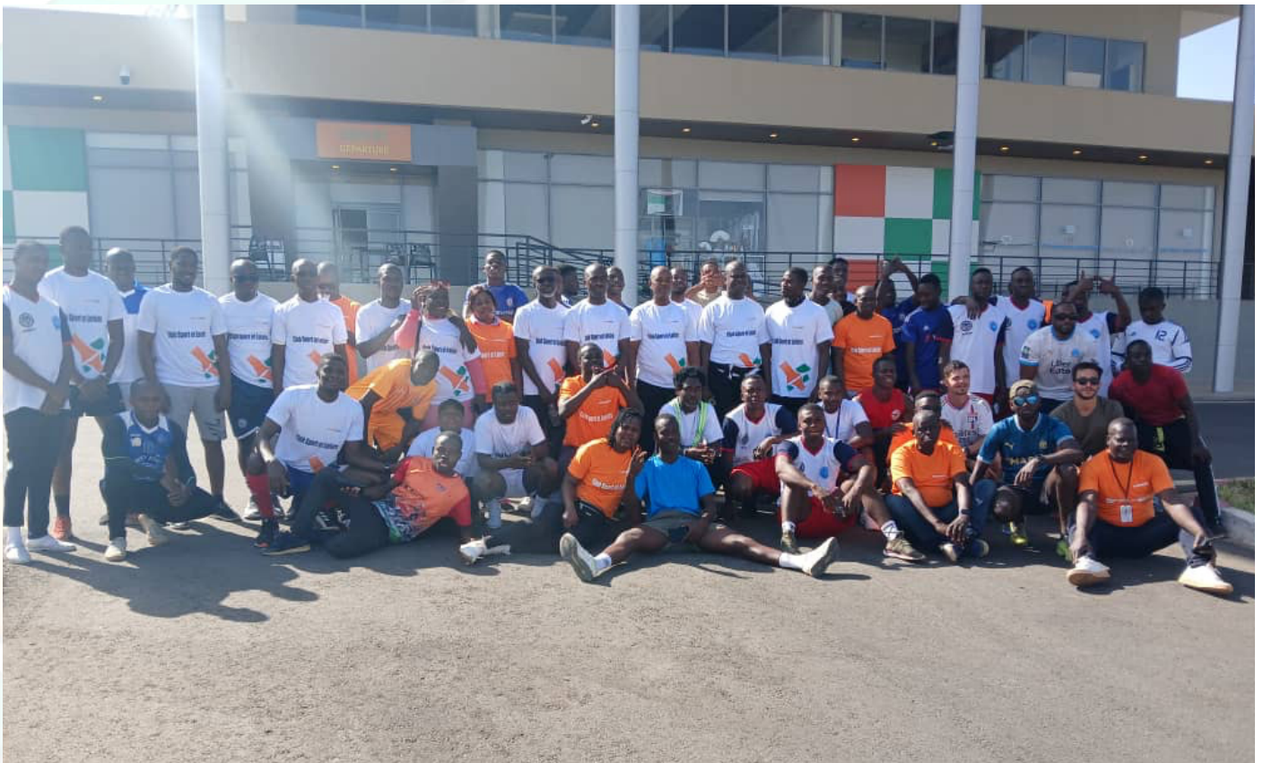
Photo de famille du personnel de la plateforme de Korhogo