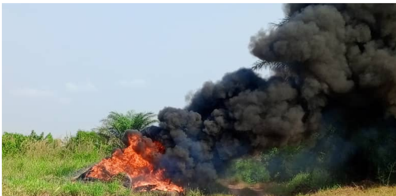
Les pompiers en plein exercice de simulation

Les sapeurs-pompiers de l'aéroport de San Pedro ont participé à un exercice sur feu réel en face de leur caserne, le samedi 28 décembre 2024 afin de tester le délai d'intervention des équipes et d'évaluer les performances du VMA 78, le véhicule d'intervention d'urgence des pompiers.