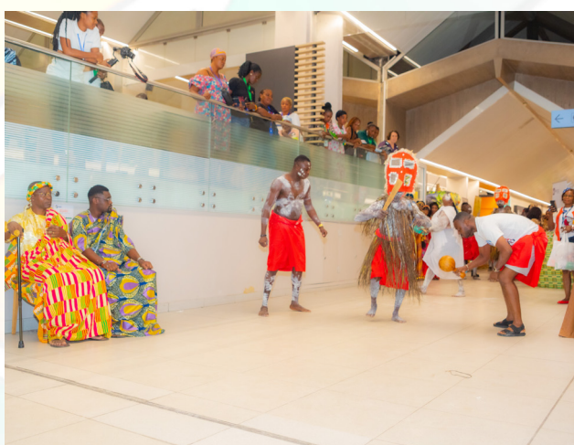
L'équipe de la SODEXAM pour la présentation de la danse des guerriers en pays Ébrié au concours des customer's day