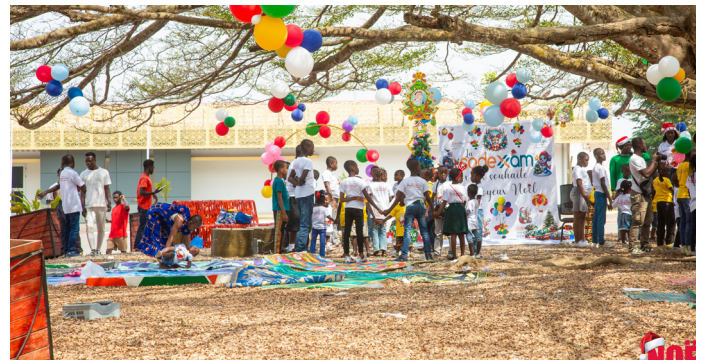
L'espace de jeu aménagé pour les tous petits dans la cour de l'aéroport