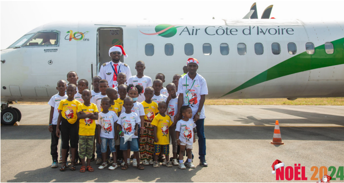
Photo de famille à l'issue de la visite des enfants dans l'avion de Air Côte d'Ivoire