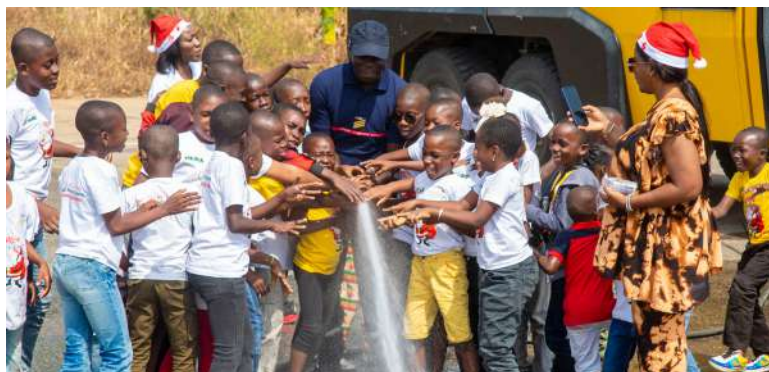
Les enfants apprennent à utiliser le canon à eau