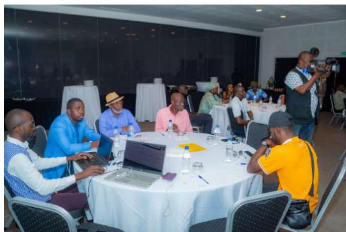
Les journalistes, attentifs à la présentation du DG