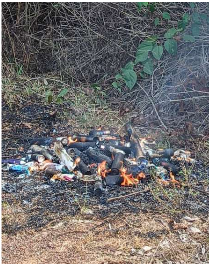
Les autorités de la plateforme de San-Pedro détruisent les articles interdits saisis à l'aéroport

Il a profité de cette occasion pour présenter ses vœux du nouvel an à l'ensemble des partenaires et collaborateurs pour leur engagement en faveur de la sécurité, la sûreté de l'aéroport, aussi bien que pour leur implication dans la réussite des opérations quotidiennes.