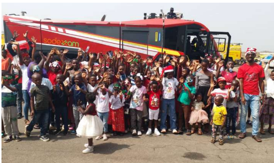
Photo de famille devant le VMA