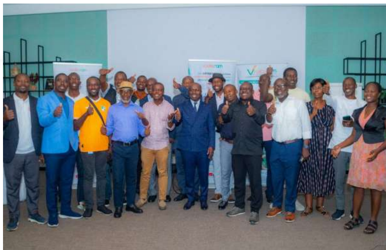
Satisfaits de leurs échanges, les journalistes et le DG immortalisent la rencontre

Au cours d'un déjeuner de presse et d'une rencontre, le Directeur Général de la SODEXAM, a échangé avec la presse nationale et internationale, et le personnel. C'étaient les vendredi 17 et mardi 21 janvier 2025, à l'hôtel ONOMO, à la salle polyvalente.