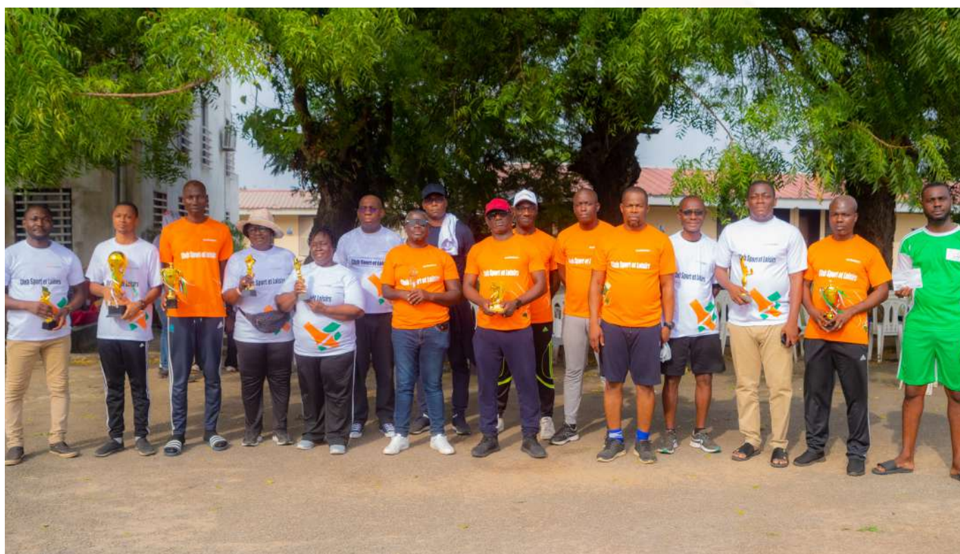
Photo de famille des vainqueurs des jeux, et le président du club sport et loisirs