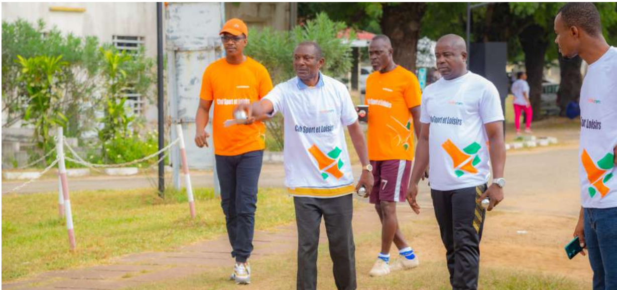
Jeu de pétanque