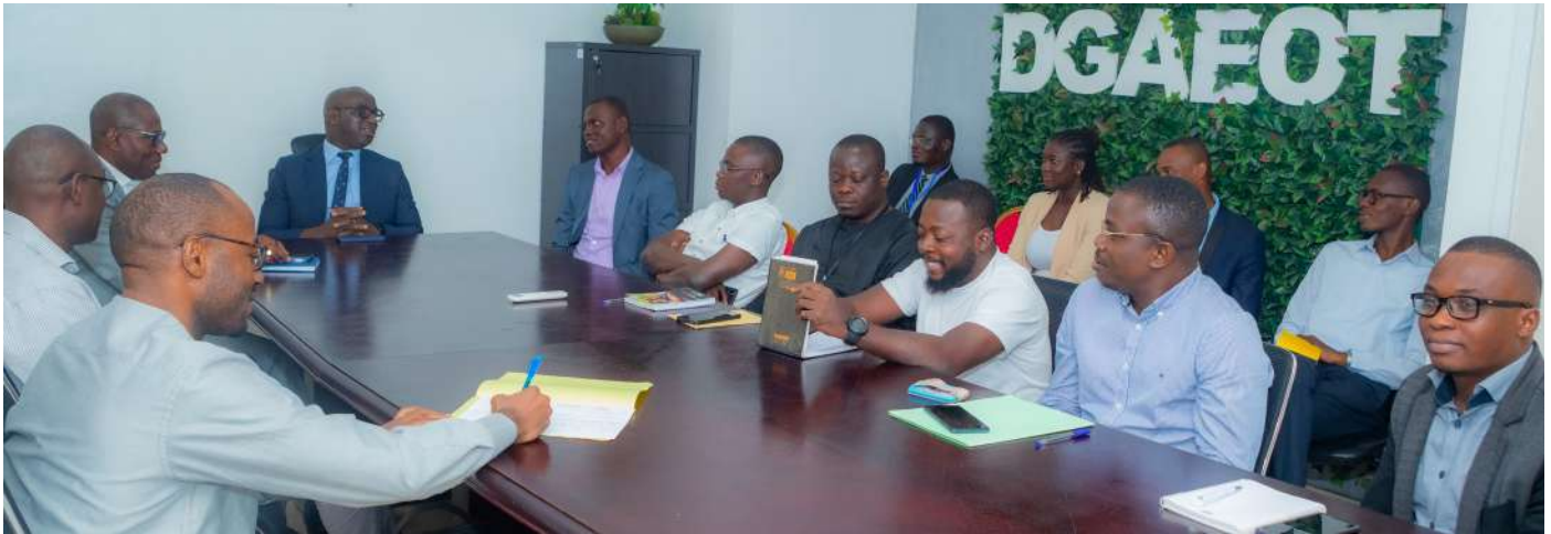
Photo d'ensemble à l'ouverture de la formation