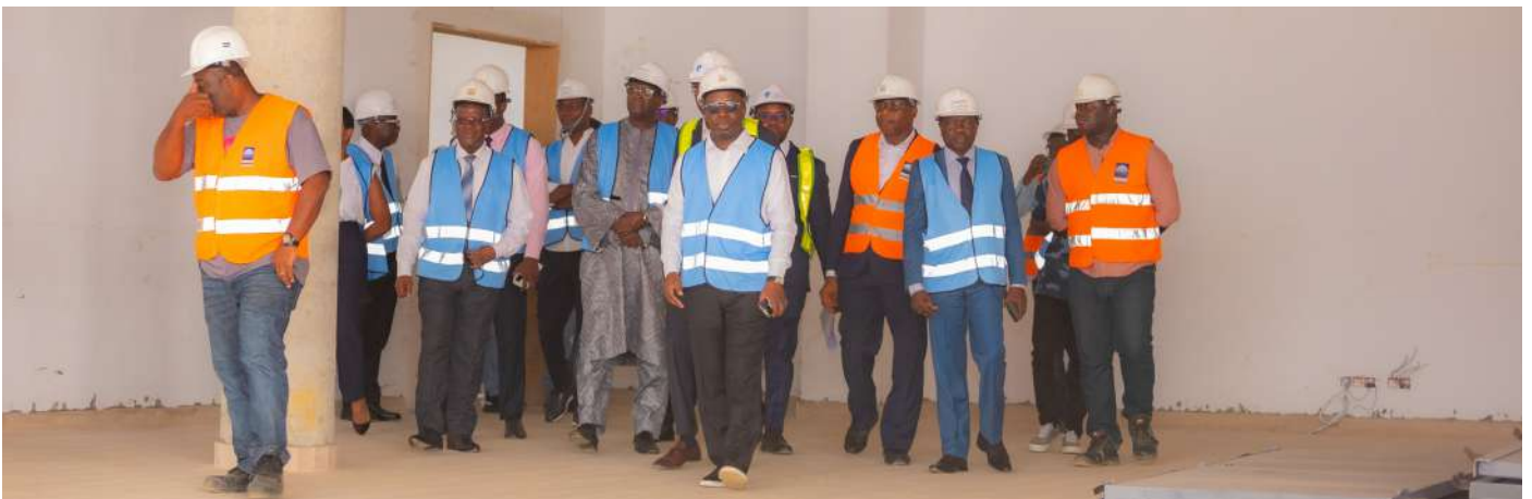
Des administrateurs et des membres du comité de direction dans le hall du bâtiment