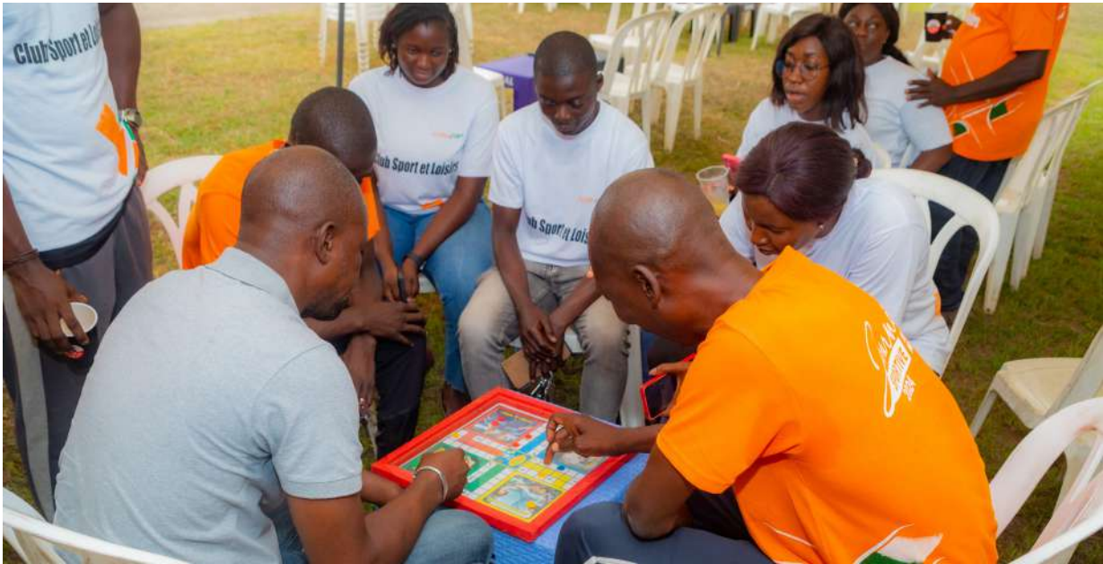
Jeu de Ludo