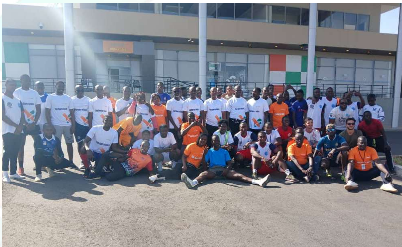
Photo de famille du personnel de la plateforme de Korhogo