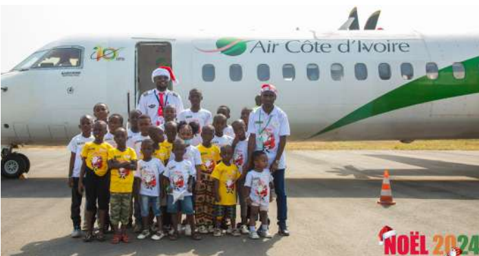
Photo de famille à l'issue de la visite des enfants dans l'avion de Air Côte d'Ivoire