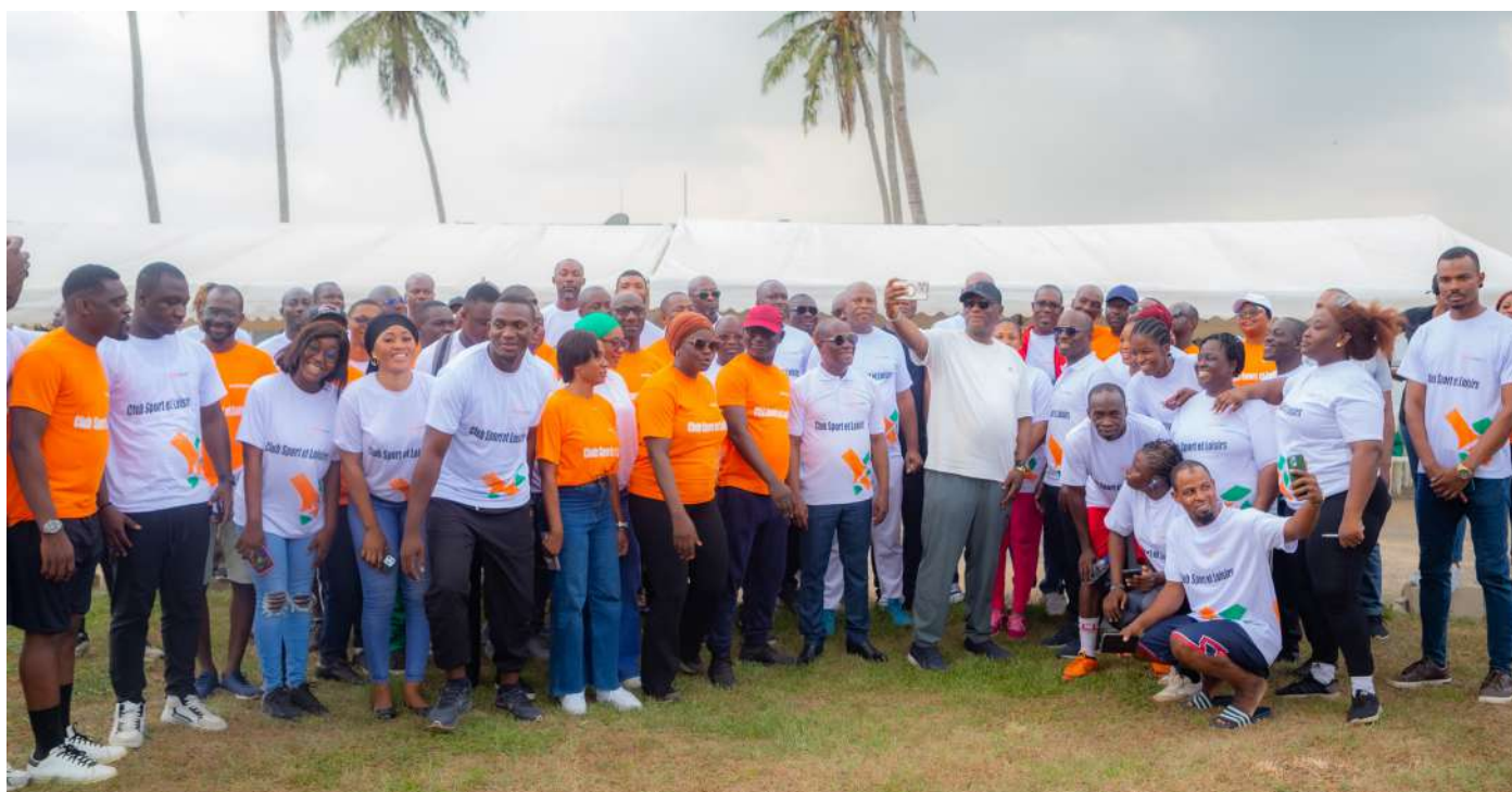
Photo de famille avec l'ensemble des agents de la plateforme d'Abidjan