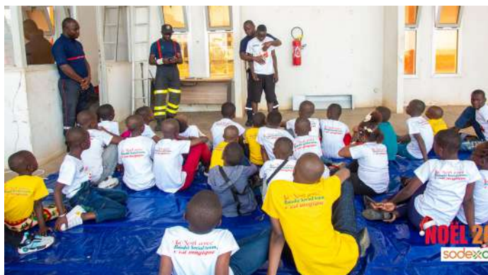
Les enfants suivent le cours sur les 1ers secours