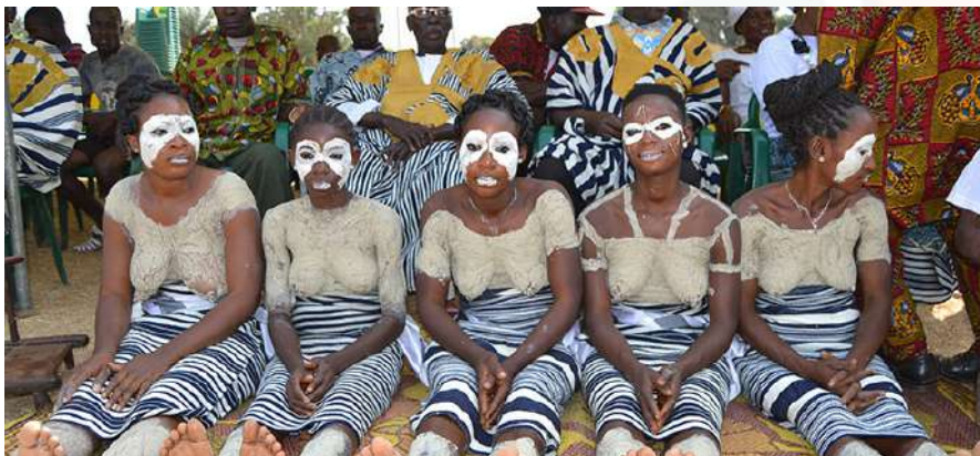
Les femmes guerrières lors du festival de Facobly

En revanche, la période fraîche s'étend de début juillet à mi-septembre, avec des températures maximales inférieures à 29 degrés. Août est le mois le plus frais, avec des températures comprises entre 22 et 28 degrés.