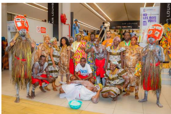
L'équipe de la sodexam au concours des customer's day