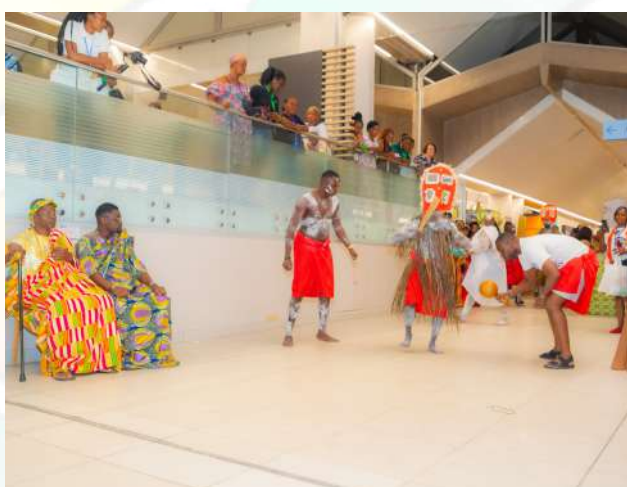
L'équipe de la SODEXAM pour la présentation de la danse des guerriers en pays Ébrié au concours des customer's day