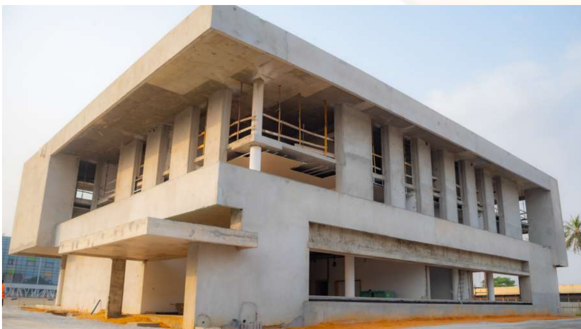
Le bâtiment du nouveau siège de la SODEXAM à 80% de finition