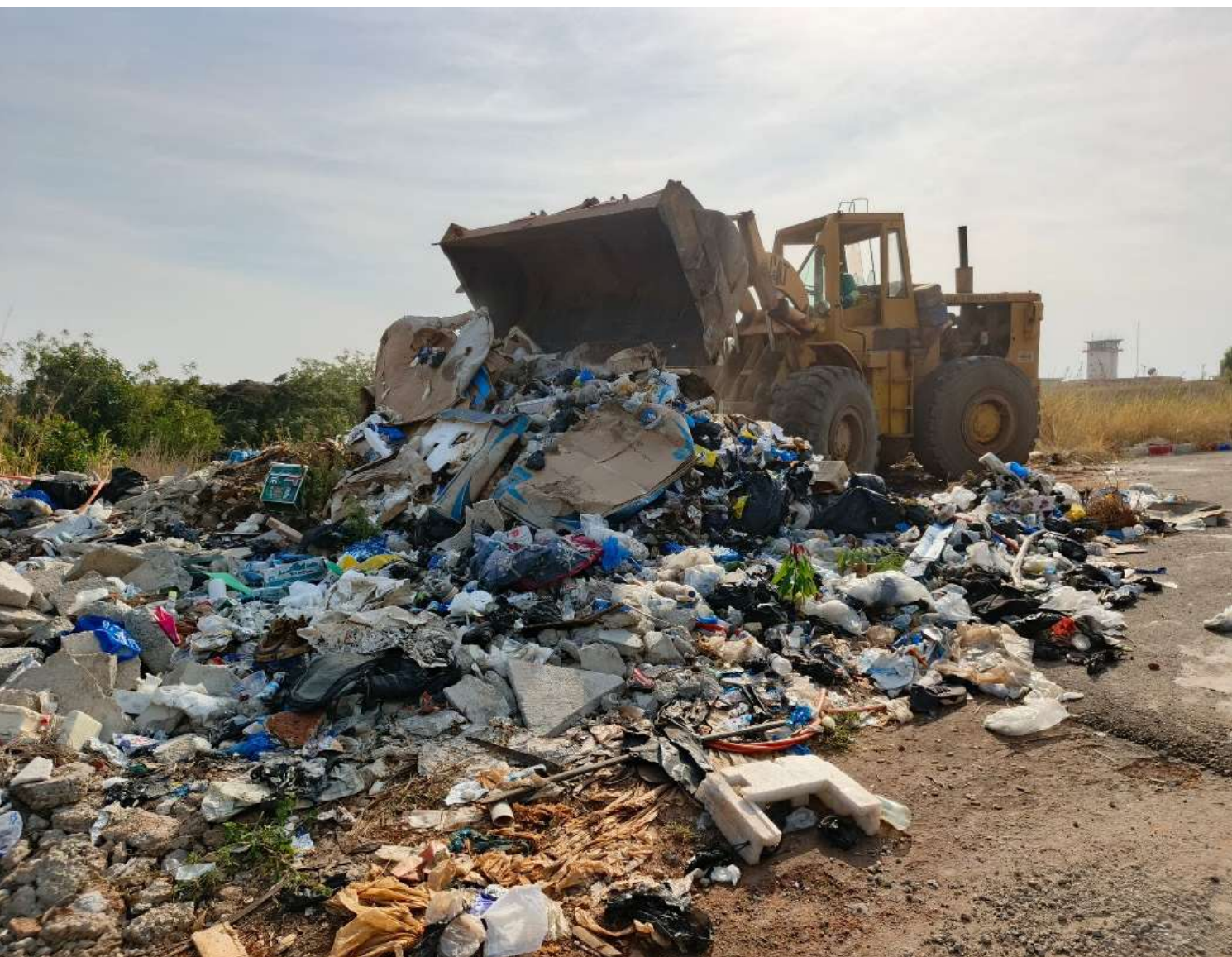
Les ordures collectées

A l'initiative de Pascal Kouamé N'GUESSAN, Commandant de l'aéroport de la ville de Korhogo, une opération d'assainissement a eu lieu à l'aéroport de ladite ville, le samedi 7 décembre 2024, en vue de débarrasser les ordures déversées du côté ville de l'aéroport après les travaux de rénovation.