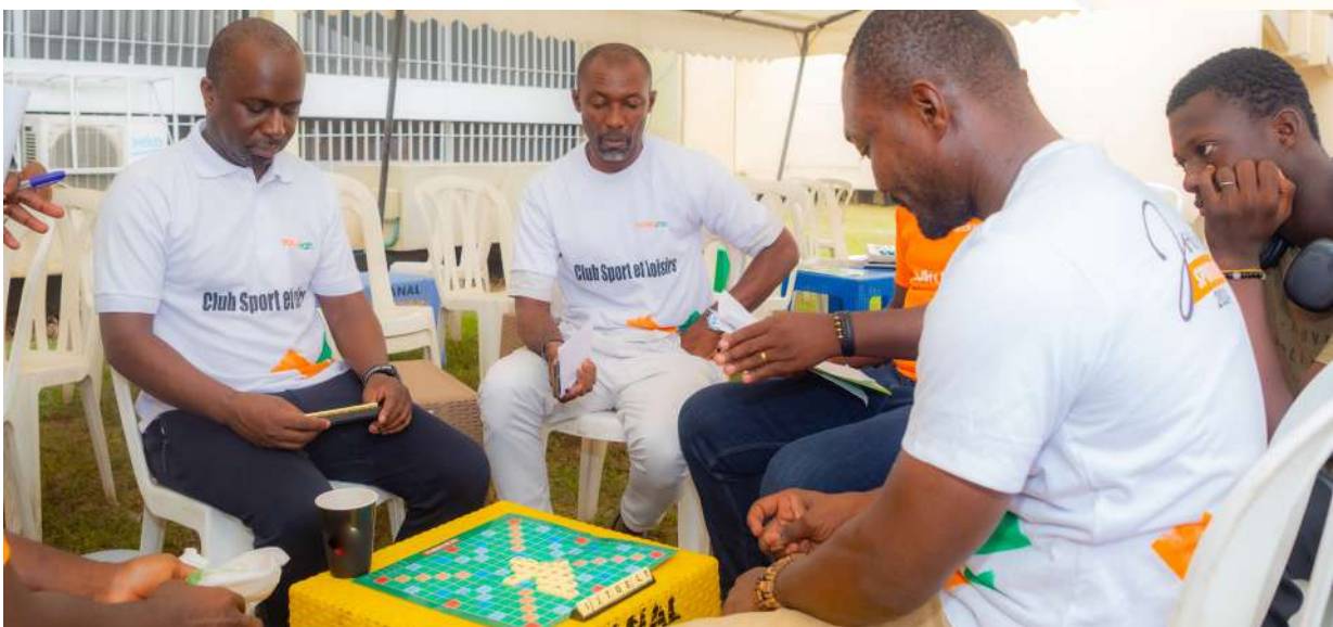
Jeu de scrabble