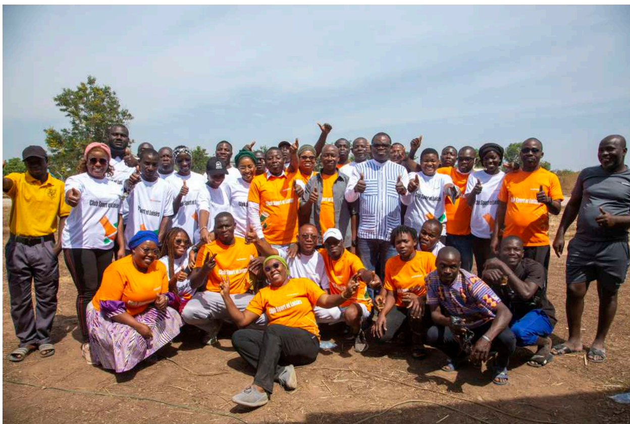
Photo de famille à l'issue de la journée sportive JLM de Bouaké