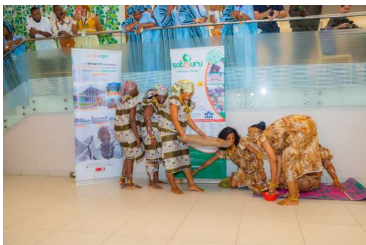
Le passage de la SODEXAM au concours des customer's day