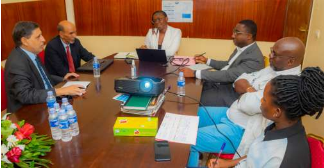
Séance de travail entre l'équipe d'évaluation de Mauritanie, la Directrice de la conformité, le Directeur du CERMA et le Médecin Chef du DEMPA