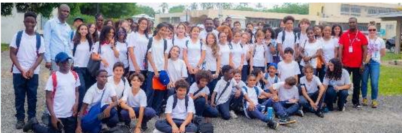
Photo de famille à l'issue de la visite des élèves du lycée international Jean Mermoz

90 élèves des classes de 5e et de 3e du lycée international Jean Mermoz ont visité la SODEXAM, le mercredi 18 décembre 2024, pour découvrir l'univers de la météorologie.