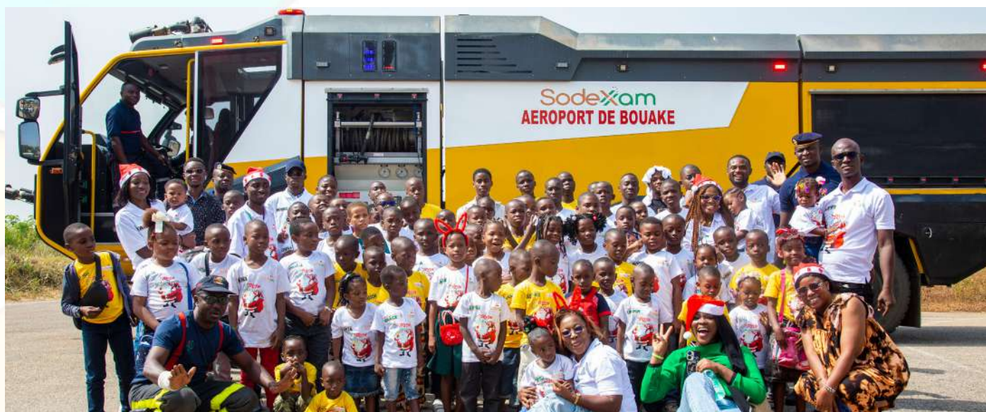
Photo de famille avec les enfants devant le VMA

Le Commandant de l'aéroport de Bouaké a organisé la première édition de la fête de Noël des enfants des agents, le lundi 23 décembre 2024. Cette activité avait pour objectif d'offrir un moment festif et éducatif à une centaine d'enfants, et de renforcer les liens sociaux entre agents.