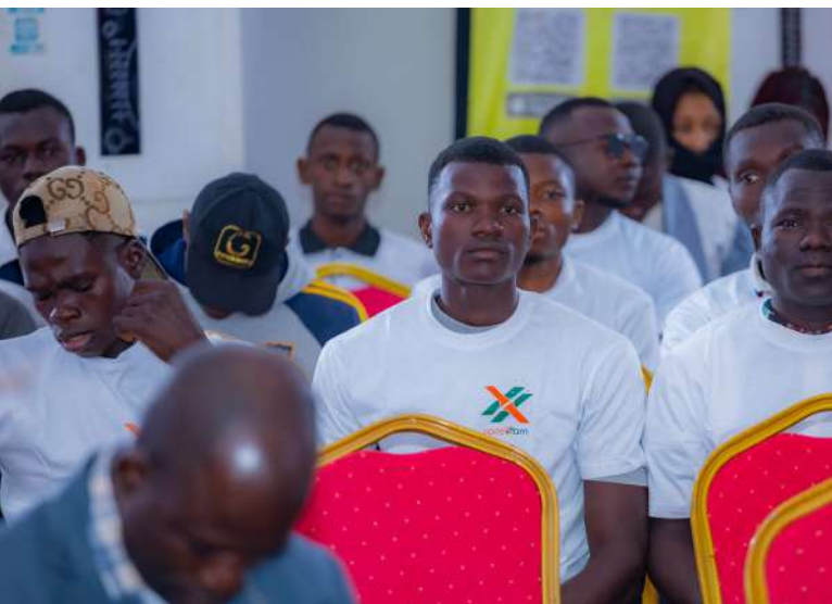
Le public attentif à la présentation de la cheffe DCRP