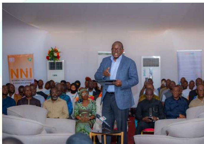
Le Ministre Directeur de Cabinet Fidèle SARASSORO à l'introduction du panel