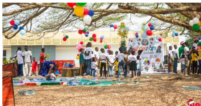
L'espace de jeu aménagé pour les tous petits dans la cour de l'aéroport