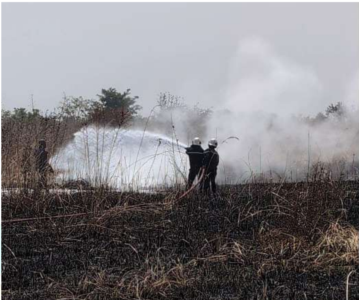
L'unité SLI en plein exercice de simulation sur feu réel

L'Unité de Sauvetage et de Lutte contre les Incendies d'Aéronef (SLIA) de l'aéroport de Yamoussoukro a mené un exercice de simulation sur feu réel, le lundi 23 décembre 2024 dont l'objectif était de tester la capacité opérationnelle des pompiers et leur réactivité en urgence.