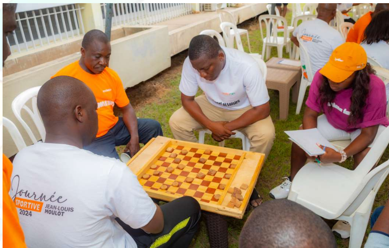
Jeu de Dames