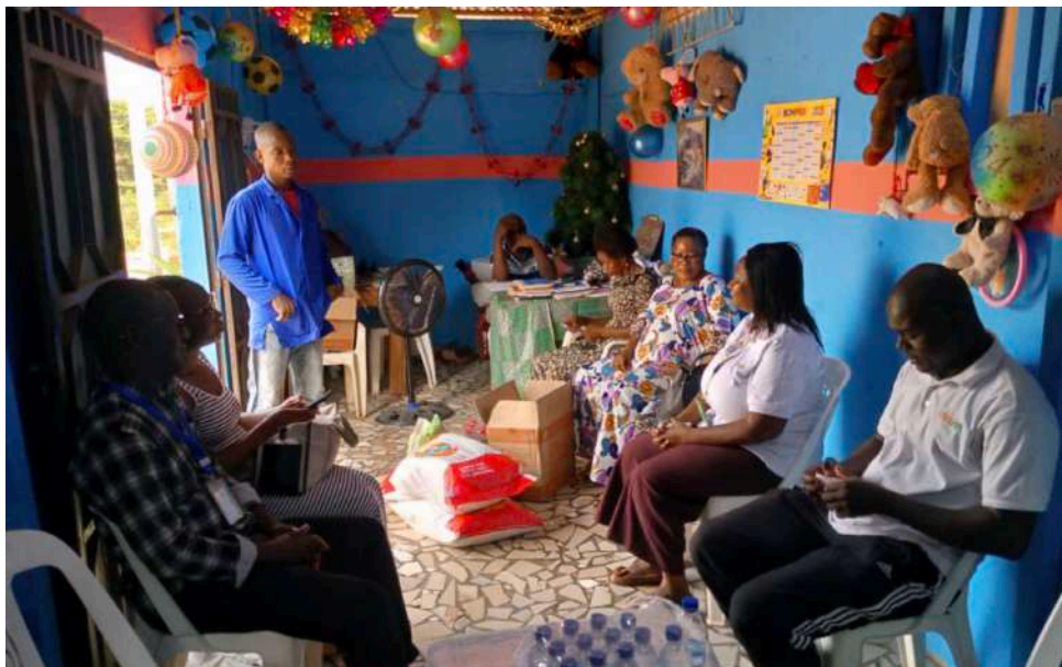
Remise de don à l'orphelinat