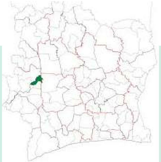
Localisation de Facobly sur la carte de la côte d'ivoire

Le climat à Facobly est caractérisé par une chaleur persistante tout au long de l'année, avec deux grandes saisons distinctes. La saison pluvieuse est oppressante et marquée par un ciel souvent nuageux, tandis que la saison sèche est lourde mais partiellement dégagée.