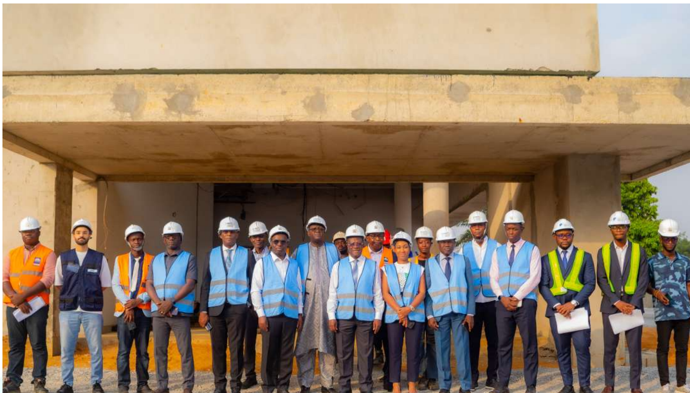
Photo d'ensemble devant le nouveau siège en construction

Les membres du Conseil d'administration de la SODEXAM se sont dits satisfaits de l'avancée des travaux du nouveau siège de la SODEXAM, à la suite d'une visite effectuée sur le chantier de construction, le vendredi 20 décembre 2024, afin de faire le point de l'avancement des travaux de cet ambitieux projet.