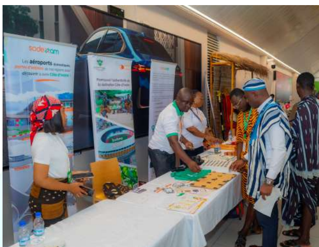
Quelques visiteurs au stand de la SODEXAM